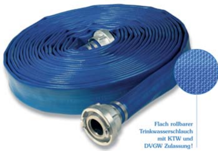
Flach rollbarer Trinkwasserschlauch mit KTW und DVGW Zulassung!

Auch komplett eingebunden als Schlauchleitung lieferbar.